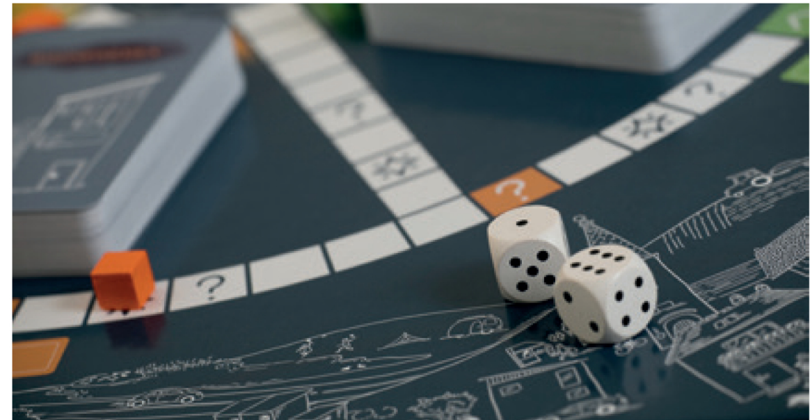
Abb. 2 Brettspiel Kein schöner Land von ARCHITEKTUR_SPIEL_RAUM_KÄRNTEN © Helga Rader