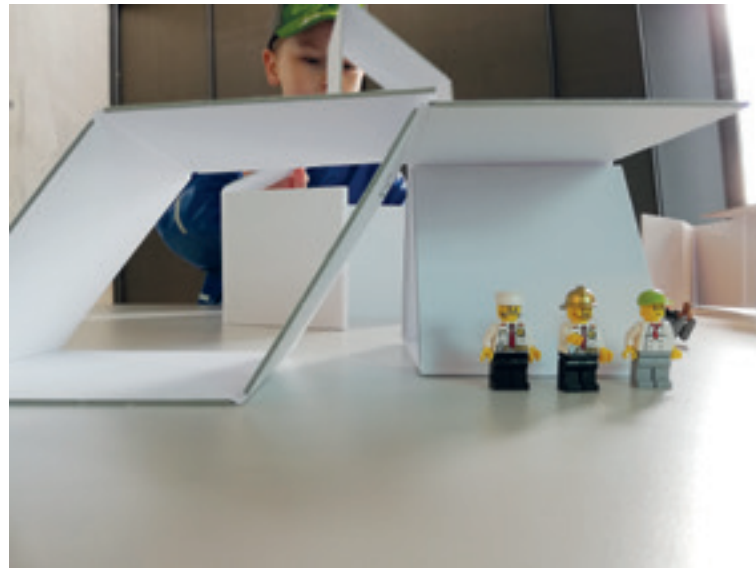
Abb. 6 Projekt Basic Space im Steinhaus