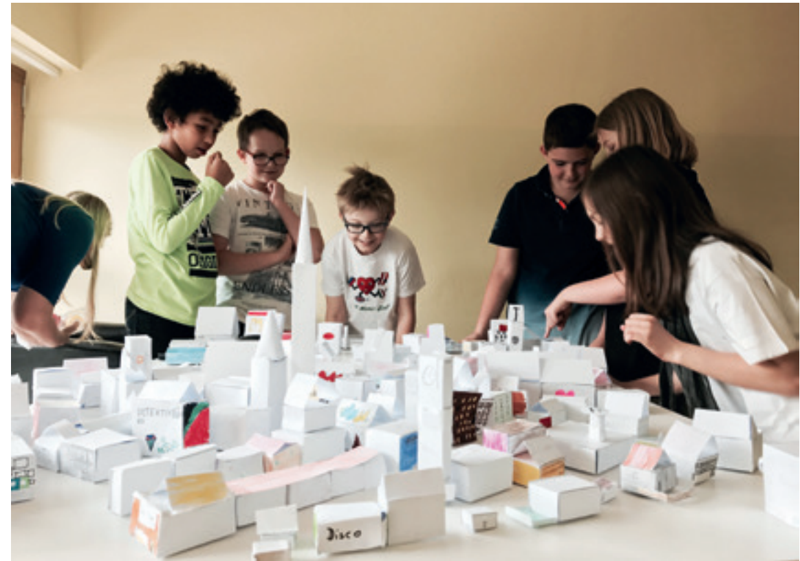
Abb. 4 Projekt In der Stadt in der VS Maria Gail

Workshops mit Schulklassen im Architektur Haus Kärnten nach Anmeldung, Juni 2026, Termine auf https://www.architektur-spiel-raum.at/dont-forget-to-play/ Bewegliche Modelle, knifflige Puzzles und süße Tragwerke: Komm zu einem Workshop, werde kreativ, baue und experimentiere!