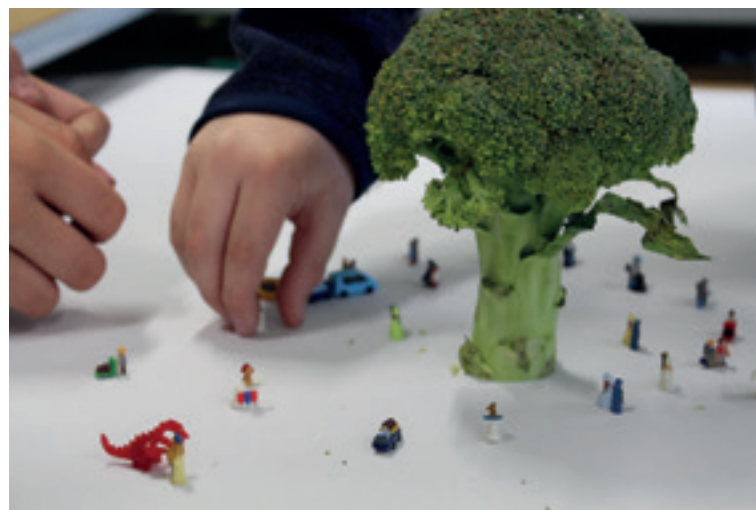
Abb. 7 Projekt BAUM_RAUM in der VS St. Leonhard bei Siebenbrunn

chern verankert: Politische Bildung wird grundsätzlich als wichtig erachtet und großteils auch vermittelt. Musikalische Bildung wird im Musikland Österreich zwar immer mehr zum Stiefkind, aber hier gibt es immerhin noch eine gewisse Identifikation und ein – wenn auch zunehmend gekürztes – Schulfach. Auch der Run auf die Musikschulen hält ungebrochen an, wenn auch nicht in allen Bevölkerungsschichten. Bei baukultureller Bildung dünnt sich das gesellschaftliche Interesse noch mehr aus: So etwas wie Architekturschulen gibt es hierzulande kaum (mit Ausnahme des großartigen bildung in Tirol) und von baukultureller Identifikation der Bevölkerung kann man (mit Ausnahme von Vorarlberg) auch kaum sprechen. Seit der Jahrtausendwende jedoch setzen hier federführend Initiativen (wie zum Beispiel der Verein at+s in Salzburg) an.