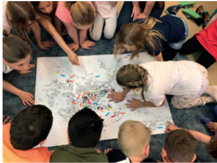
Abb. 5 Projekt In der Stadt in der VS Maria Gail