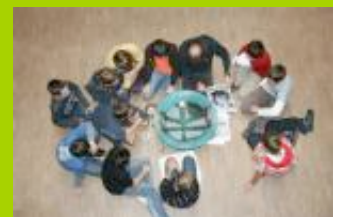
Workshop: "Klangraum - Raumklang", Foto: Sonja Hohengasser