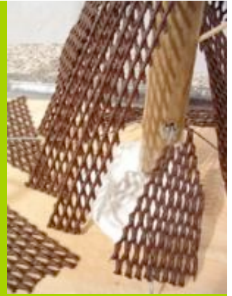
Workshop: "Architektur schmeckt gut"

ARCHITEKTUR_SPIEL_RAUM_KÄRNTEN ist eine Interessensgemeinschaft, bestehend aus ArchitektInnen, PädagogInnen, KünstlerInnen, die gemeinsam versuchen, jungen Menschen in Kärnten die Themen der Architektur nahezubringen, sie zu sensibilisieren und für qualitätvolle Architektur zu begeistern. Ähnliche Initiativen aus ganz Österreich haben sich kürzlich zu einem aktiven Netzwerk zusammengeschlossen, das die Anliegen der Architekturvermittlung für Kinder und Jugendliche stärker transportieren soll. Die Workshopreihe "Treffpunkt Architektur" versteht sich als ein lebendiges Zeichen dieses kreativen Netzwerks.