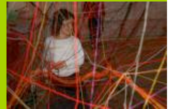
Workshop: "Dschungel - Dickicht - Labyrinth", Foto: Christine Aldrian-Schneebacher