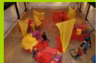
Workshop: "Dschungel - Dickicht - Labyrinth", Foto: Christine Aldrian-Schneebacher