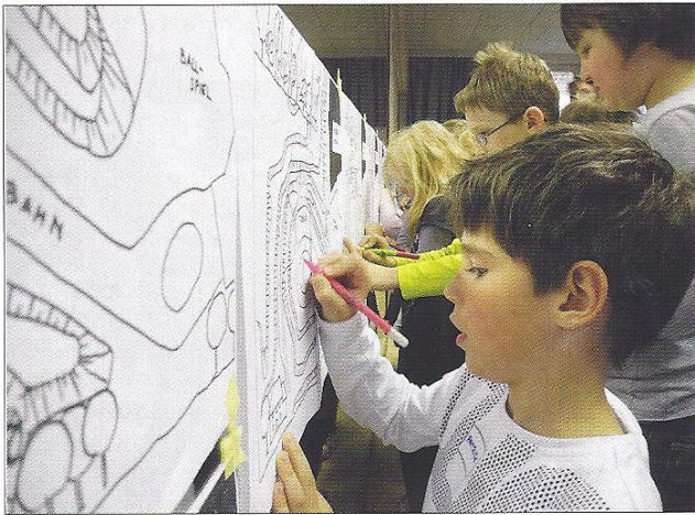
Die Lieblingsplätze am neuen Arenaspielplatz wurden in Karten eingezeichnet.